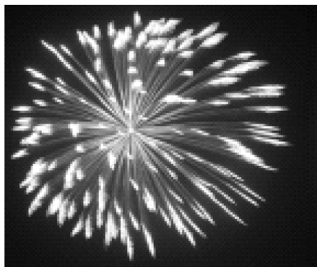
(a) 单个烟花爆炸产生火花

点燃的烟花被发射到夜空中,爆炸产生火花继而照亮其临近的夜空,产生出一幅美丽的图案。事实上,一个优化问题的求解过程亦是如此。对于一个最优化问题,尤其自变量是连续空间的最优化问题,在整个解空间内,如何有效迅速地找到全局最优解呢?在烟花算法中,烟花被看作为最优化问题的解空间中一个可行解,那么烟花爆炸产生一定数量火花的过程即为其搜索邻域的过程,如图 1 所示。