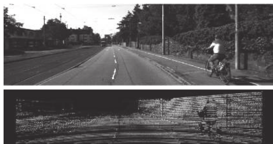
图1 KITTI数据集示例 [19] Fig. 1 KITTI dataset examples

激光雷达由于其主动感知的特性,以及相对雷达提供了更密集的点云,因此在自动驾驶的传感器中受到较多的应用 [44-46] 。图1中给出了KITTI数据集中RGB图像和激光雷达点云的示例,其中点云反射强度图被投影到相机成像平面,且所显示的均为灰度图。激光雷达不仅可以提供较大的感知范围,扫描半径可达50~70 m,甚至更远,而且激光雷达可以提供环境的深度信息和反射率,且不受环境光照的影响。激光雷达数据为三维点云格式,因此点云的坐标自然地提供了物体相对激光雷达的三维空间坐标,可以用于三维空间的目标检测;点云的反射强度值反映了物体表面的材质,因此不同的物体可以根据反射强度被很容易地区分开。