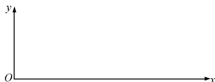
图1 D-U 空间

均值-方差系数 u(\bar{x}, s) 中的均值 \bar{x} 和方差 s 的相互作用则可以映射到基于集对分析的二维确定-不确定空间 [17] (determination-uncertain, 简称 D-U 空间) 作进一步分析. 如图 1、2 所示, 其中的 y 轴表示相对不确定性测度, x 轴表示相对确定性测度。